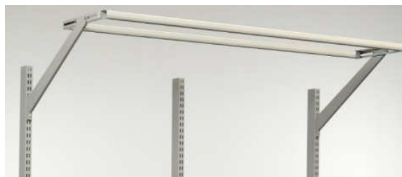
Направляющая со скользящими крючками для инструмента, панель освещения