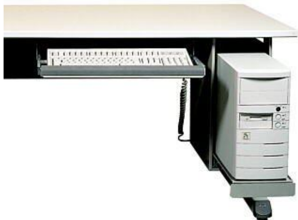
Полка для ПК и клавиатуры