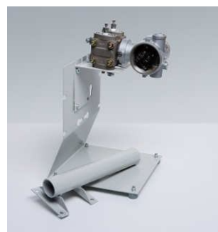
Штатив для приборов