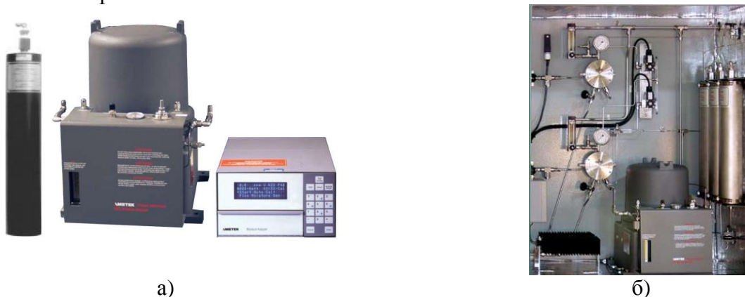
Рисунок 1 - Фотография общего вида анализатора влажности "Ametek" модели 5000 (а) и анализатора с системой пробоотбора 561 (б)

Схема пломбировки анализаторов 5830 и 5800 от несанкционированного доступа представлена на рис. 2.