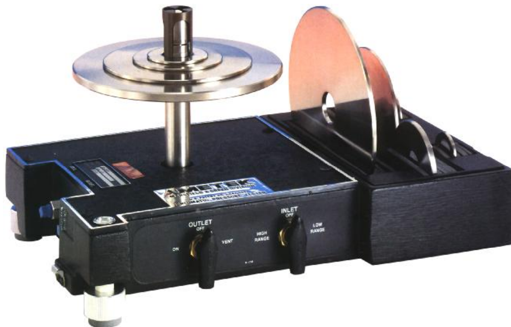
Рис. 2. Внешний вид пневматического грузопоршневого калибратора давления РК