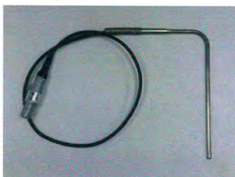
Рисунок 3 - Общий вид внешних ТС моделей STS-120, STS-150