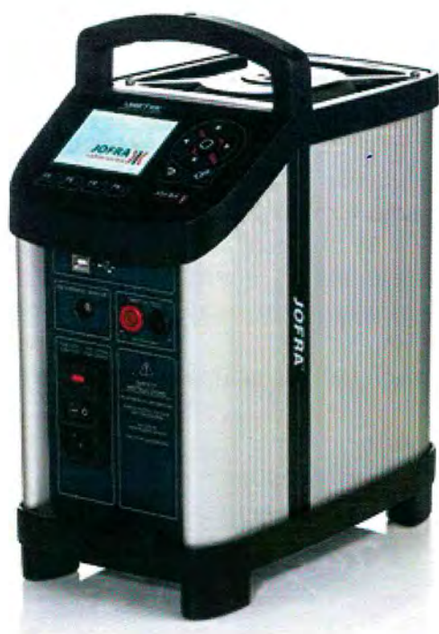
Рисунок 1 - Общий вид калибраторов температуры JOFRA серии CTC-R моделей CTC-155A, CTC-155C, CTC-350A, CTC-350C, CTC-660A, CTC-660C