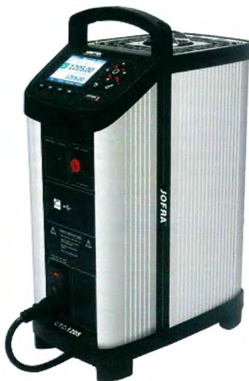
Рисунок 2 - Общий вид калибраторов температуры JOFRA серии CTC-R моделей CTC-1205A, CTC-1205C