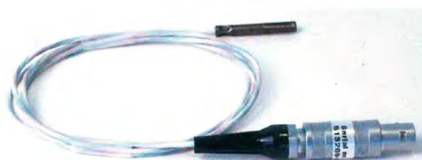
Рисунок 4 - Общий вид внешнего ТС модели STS-102