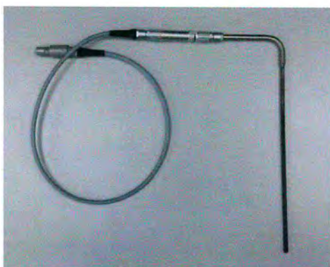
Рисунок 5 - Общий вид внешнего ТС модели STS-200