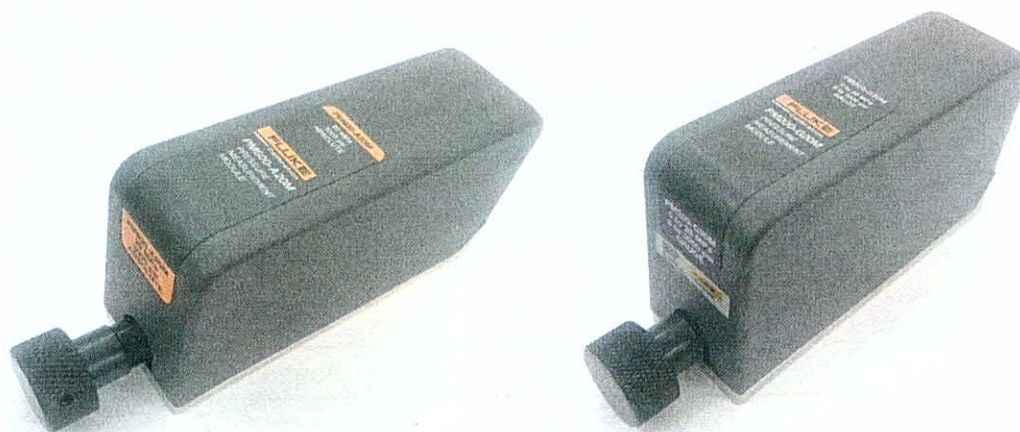
Рисунок 2 - Внешний вид встраиваемых модулей давления РМ600 и РМ200