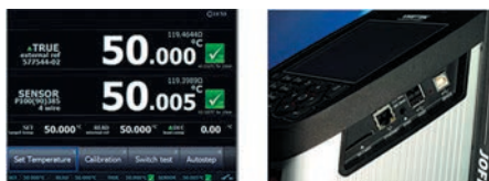
Рис. 6. Автоматическая поверка и калибровка датчиков (в т.ч. с использованием ПК)

та для компенсации этого перепада. Это обеспечивает высокую однородность распределения температуры в рабочей зоне до 60 мм от дна трубки вне зависимости от количества и/или диаметра вставленных датчиков.