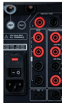
Рис. 4. Передняя панель калибратора RTC исполнения В с клеммами для измерения сигналов поверяемых датчиков

Калибраторы исполнения В позволяют измерять сигналы поверяемых термопар и термометров сопротивления (мВ, Ом, В, мА) по ГОСТ, IEC и DIN. При полевом использовании калибраторов температуры очень удобно, когда для измерения выходных сигналов поверяемых датчиков температуры и сигнала внешнего эталонного термометра не нужно носить с собой еще и внешний измеритель температуры и мультиметр, а можно