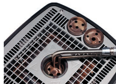
Рис. 3. Вставная трубка для установки датчиков различных диаметров

Исполнения В и С снабжены схемой измерения сигнала внешнего эталонного термометра сопротивления. Такой термометр устанавливается непосредственно в рабочей зоне рядом с поверяемым датчиком и подключается к специ-