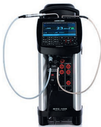
Рис. 2. Калибратор RTC-159В с эталонным термометром Pt100 и датчиком DLC

В калибраторе RTC-159 для охлаждения термостата до -100\text{ }^{\circ}\text{C} используется уникальная технология теплового насоса Стирлинга с газовым теплоносителем (FPSC), позволяющая достигать