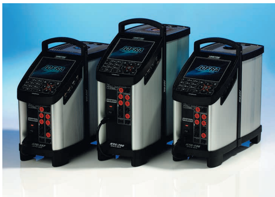
Рис. 1. Калибраторы температуры серии RTC-R

требования, соответствие которым в свою очередь является основанием для выбора того или иного прибора. В первую очередь эти требования касаются метрологических характеристик калибраторов температуры, таких как погрешность поддержания и измерения температуры, воспроизводимость, градиенты температуры в рабочей зоне с учетом влияния загрузки термостата и т.п. Затем следуют критерии, касающиеся удобства в работе, при-