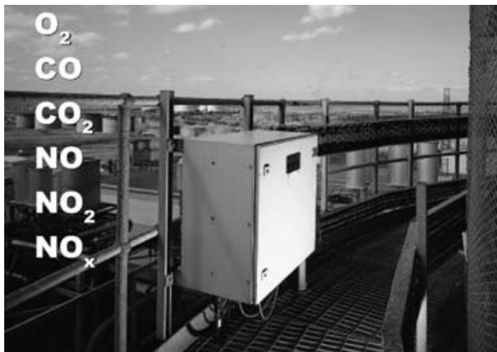
Анализатор мониторинга выбросов LAND, установленный на дымовой трубе

во-вторых, сконденсировать пары воды, в большом количестве содержащиеся в дымовых газах. Естественно, что при конденсации паров воды концентрация компонентов, (например, кислорода) изменяется. Кроме того, с конденсатом уходит небольшое количество окислов серы или углерода, и измерение может оказаться недостаточно точным. Поэтому измеренную таким образом, например, концентрацию кислорода сложно использовать для управления процессом горения в печи. Однако, что касается измерения окислов — серы, азота и углерода, решение, основанное на конденсации паров воды, считается приемлемым: при этом требования к анализатору значительно упрощаются и можно использовать относительно недорогие и надежные приборы.