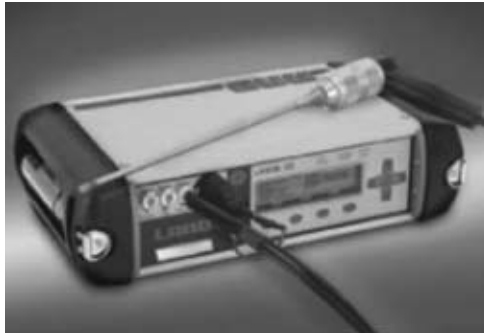
Переносной анализатор выбросов в дымовых газах LANCOM III

Подводя итог, можно сказать, что семейство переносных или стационарных анализаторов LAND отвечает самым современным требованиям, предъявляемым к системам мониторинга и регистрации выбросов на различных промышленных объектах. Учитывая простоту монтажа и эксплуатации, такие системы больше всего подходят для мощных тепловых электростанций, работающих на природном газе, а также для компрессорных станций по перекачке природного газа.